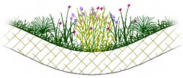
Noue, espace vert creux