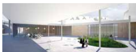
Vers + de bien-être et M.S.A.

Plus d'informations: Contrat de quartier Primeurs-Pont de Luttre, 02 348 17 12