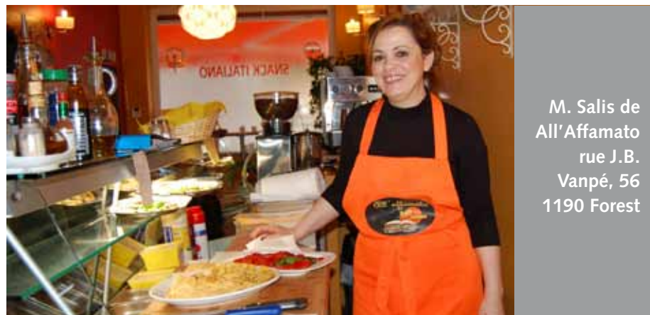
M. Salis de All'affamato rue J.B. Vanpé, 56 1190 Forest

Voor alle inlichtingen: Dienst Economische Transitie van de Gemeente Vorst: 02 370 22 72, pierreverbruggen@forest.irisnet.be